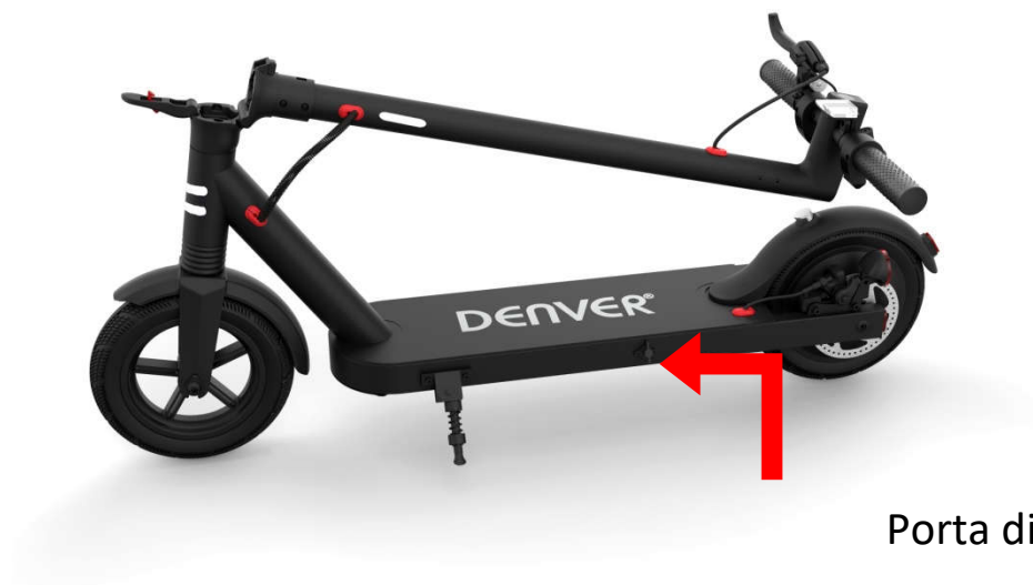
Porta di ricarica

Collegare l'adattatore di alimentazione in dotazione alla porta di ricarica del monopattino elettrico.